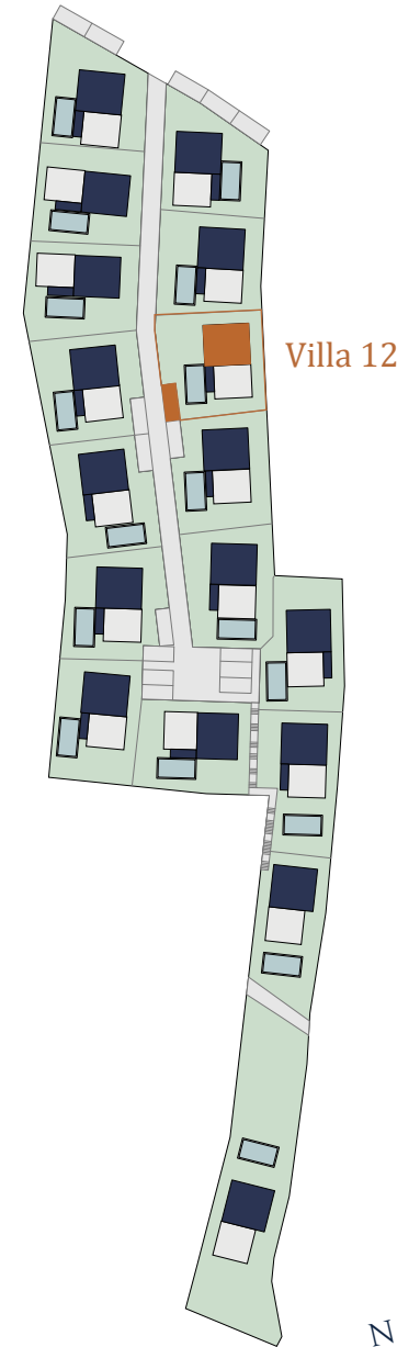
Übersicht | Lage

Bei Immobilien zu Hause. Seit 3 Generationen.